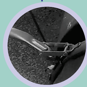
Aro Metálico Galvanizado Fecho Rápido