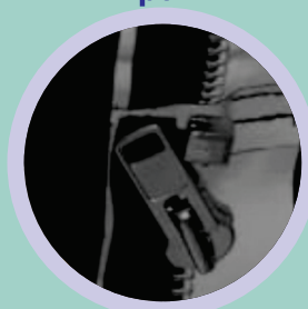
Zipper com Velcro