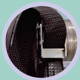
Cinta de Amarração Trava de Zamac