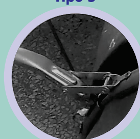
Aro Metálico Galvanizado Fecho Rápido