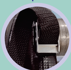
Cinta de Amarração Trava de Zamac