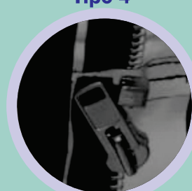
Zipper com Velcro