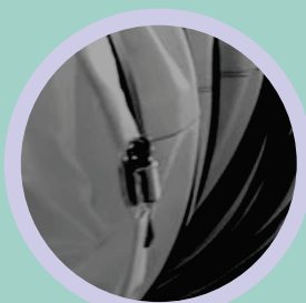
Abraçadeira Metálica Embutida