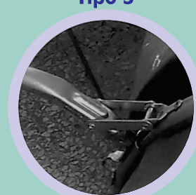
Aro Metálico Galvanizado Fecho Rápido