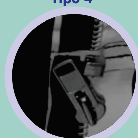
Zipper com Velcro