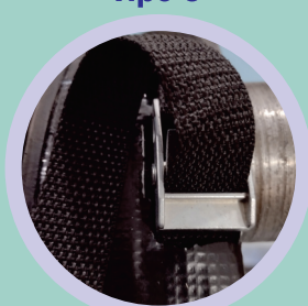
Cinta de Amarração Trava de Zamac