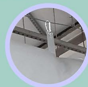
Diâmetros (pol. " / mm)