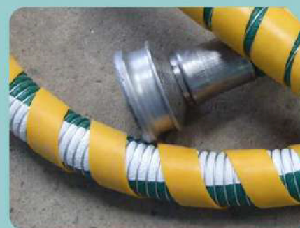
Revestimento Externo de Proteção